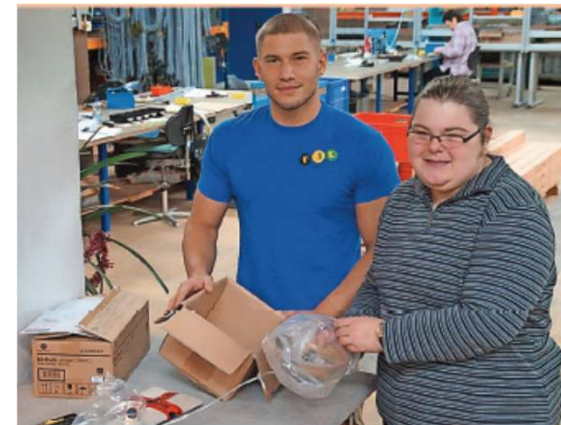
Einbeziehung der Weißenburger Werkstätten für Behinderte